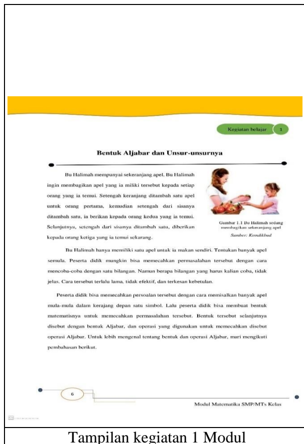
Gambar 2. Tampilan Cover dan Kegiatan 1 Modul