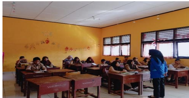
Gambar 3. Penerapan Modul

Berdasarkan hasil uji coba keseluruhan angket kepraktisan skor rata-rata media adalah 4,5 dengan kategori sangat praktis. Dapat dilihat pada table 4 berikut: