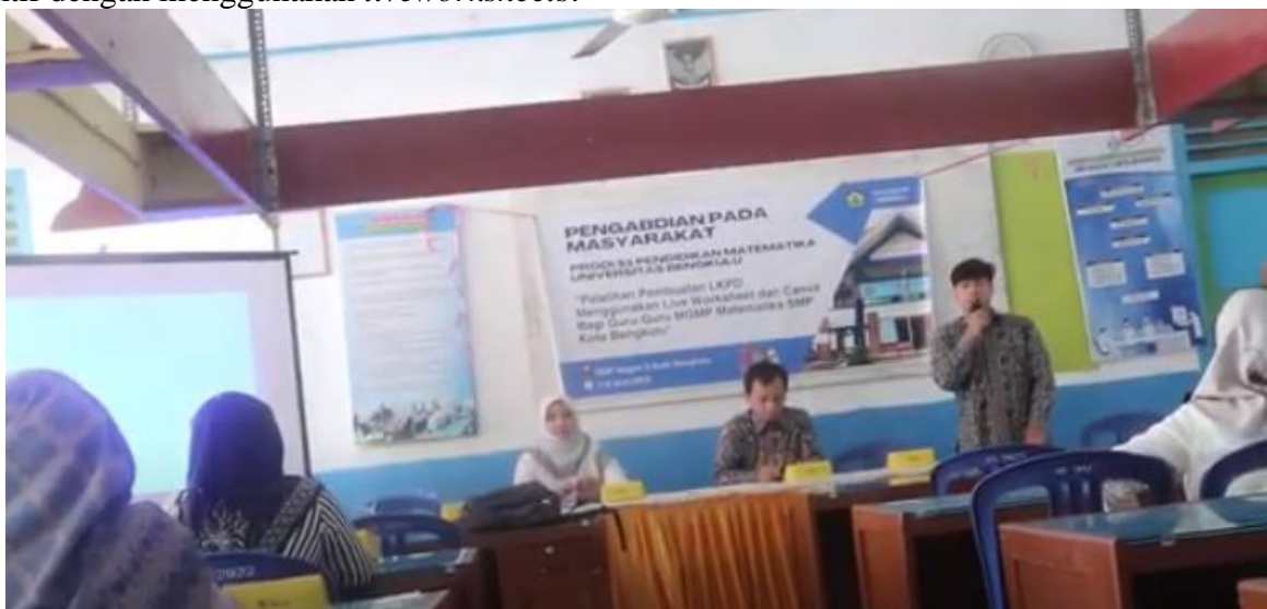
Gambar 2. Penyampaian Materi Pembuatan Kuis Interaktif dengan Menggunakan Liveworksheets

Agenda kegiatan pengabdian dilakukan pemaparan materi dengan nara sumber adalah tim pengabdian yang berjumlah 3 (tiga) orang. Materi yang diberikan saat pelatihan adalah cara membuat kuis interaktif dengan menggunakan liveworksheets .