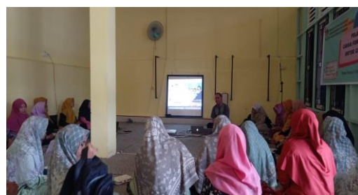
Gambar 2. Pembukaan oleh Ketua Jurusan PIAUD