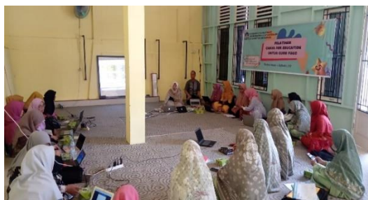
Gambar 3. Penyampaian Materi tentang Canva for education