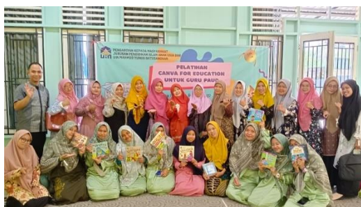
Gambar 6. Photo Bersama Selesai Kegiatan Pelatihan Canva for education

Hasil diskusi tanya jawab dan observasi langsung selama PKM berlangsung, diperoleh hasil sebagai berikut: