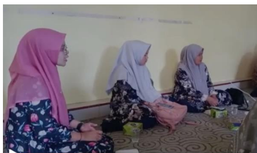
Gambar 5. Evaluasi dan Diskusi terkait dengan Kegiatan Pelatihan Canva for education