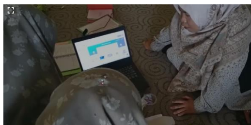
Gambar 4. Peserta Pelatihan Didampingi Dalam Pembuatan Buku Cerita Bergambar Melalui Aplikasi Canva for education