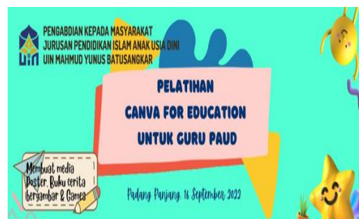
Gambar 1. Desain Spanduk Pelatihan Canva

Pelaksanaan kegiatan pengabdian masyarakat berlangsung pada Hari Kamis-Jum'at, 15-16 September 2022 yang dilakukan secara luring disalah satu TK yang ada di Kota Padang Panjang. Pengabdian masyarakat ini ditujukan untuk Guru PAUD Kota Padang Panjang yang berjumlah 30 orang guru. Pada tahap awal dilakukan cek dan re-cek segala kebutuhan dan keseluruhan rangkaian persiapan dari pelaksanaan pertemuan secara luring yang akan dilakukan pada pelaksanaan kegiatan pengabdian kepada masyarakat seperti materi dan koneksi internet. Selain itu, tim pengabdian juga menghubungi ketua lembaga mitra untuk membagikan modul pelatihan tentang seputar tentang Vanva dan cara menginstal aplikasi canva baik di laptop maupun di Handphone.