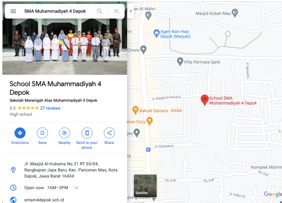
Gambar 1. Peta Lokasi SMA Muhammadiyah 4 Depok

Oleh karena itulah bentuk pelatihan Microsoft Excel sebagai peningkatan keterampilan hard skill siswa SMA Muhammadiyah 4 Depok yang akan dilaksanakan nantinya menjadi solusi tepat. Pada era digitalisasi kreatifitas anak menjadi sangat penting, karena itu perlu pembekalan program komputasi seperti Microsoft Office salah satunya Microsoft Excel . Microsoft Excel diberbagai kebutuhan sering digunakan seperti menyusun laporan keuangan (Fajrinshanty, dkk, 2019), pelatihan dalam pengelolaan data dan penyusunan laporan keuangan (Mulyani, dkk, 2019) (Arsi, dkk, 2019), penerapan ilmu statistik di SMA seperti penginputan data ke tabel (Sihombing & Rahmawati, 2019), pelatihan atau traning oleh lembaga kursus (Azhar, dkk, 2019), dan masih banyak hal lain yang bisa dilakukan Microsoft Excel .