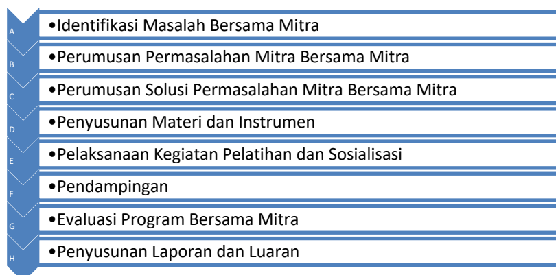
Gambar 2. Alur Metode Kegiatan Pengabdian Masyarakat (Febriandirza, dkk, 2021)

Gambar 2 dibawah ini menunjukkan alur metode kegiatan pengabdian kepada masyarakat.