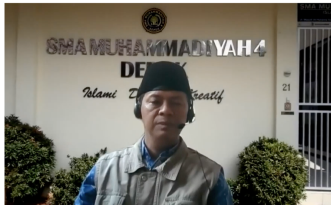
Gambar 3. Sambutan dari Kepala Sekolah SMA Muhammadiyah 4 Depok

Pelaksanaan kegiatan tersebut diawali oleh sambutan Kepala SMA Muhammadiyah Depok, yang dilanjutkan dengan perkenalan dan maksud dari tujuan melakukan pengabdian, kemudian narasumber memberikan materi dan pelatihan bagaimana menggunakan program Microsoft Office Excel dalam menyusun laporan keuangan.