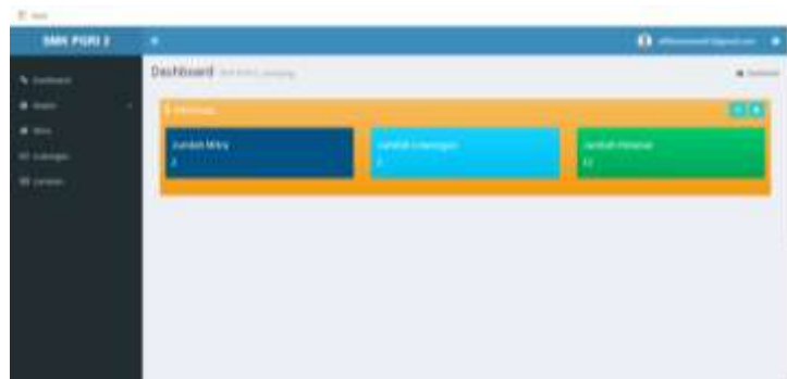
Gambar 4. Halaman awal admin

Pada halaman awal jika admin akan login harus mengisi email dan password yang sudah ditetapkan sebelumnya. Jika admin sudah login maka selanjutnya akan muncul halaman admin sebagai berikut: