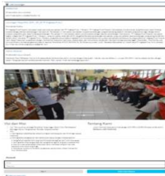
Gambar 3. Halaman Utama Website

Ketika pengguna sudah mengetikkan alamat website pada address bar maka akan muncul tampilan sebagai berikut: