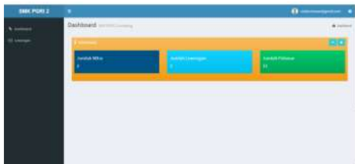
Gambar 5. Halaman Mitra

Mitra hanya memiliki menu lowongan. Halaman mitra dapat dilihat pada gambar 5.