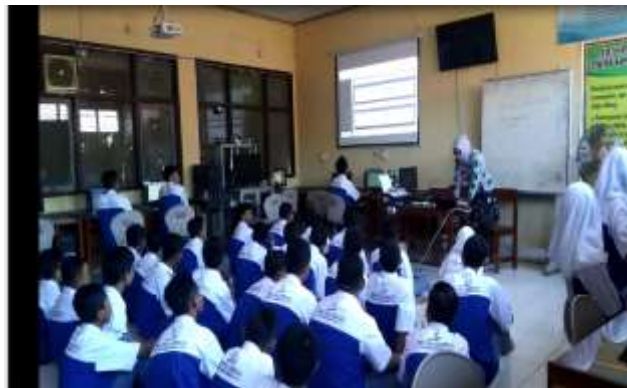
Gambar 1. Persiapan Pelatihan

Dari hasil pelaksanaan pengabdian ini luaran yang diperoleh adalah sebuah website sekolah yang dapat diakses secara online melalui URL www.smkpgri2jombang.sch.id . Website ini nantinya dikelola oleh sekolah SMK PGRI 2 Jombang. Untuk mempersiapkan pelatihan, tim pengabdian telah menyusun modul pelatihan yang akan menjadi pegangan dan pedoman pengguna selama kegiatan pelatihan. Selain itu pelaksana pelatihan harus mengakses URL website tersebut pada halaman browser pada perangkat komputer yang sudah disediakan sebelumnya.