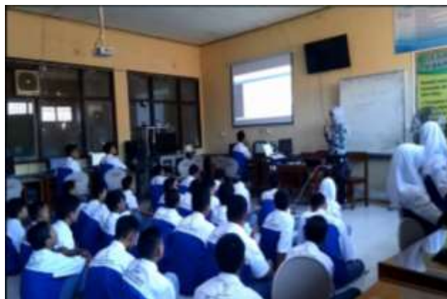
Gambar 2. Ketua Memberikan Pelatihan