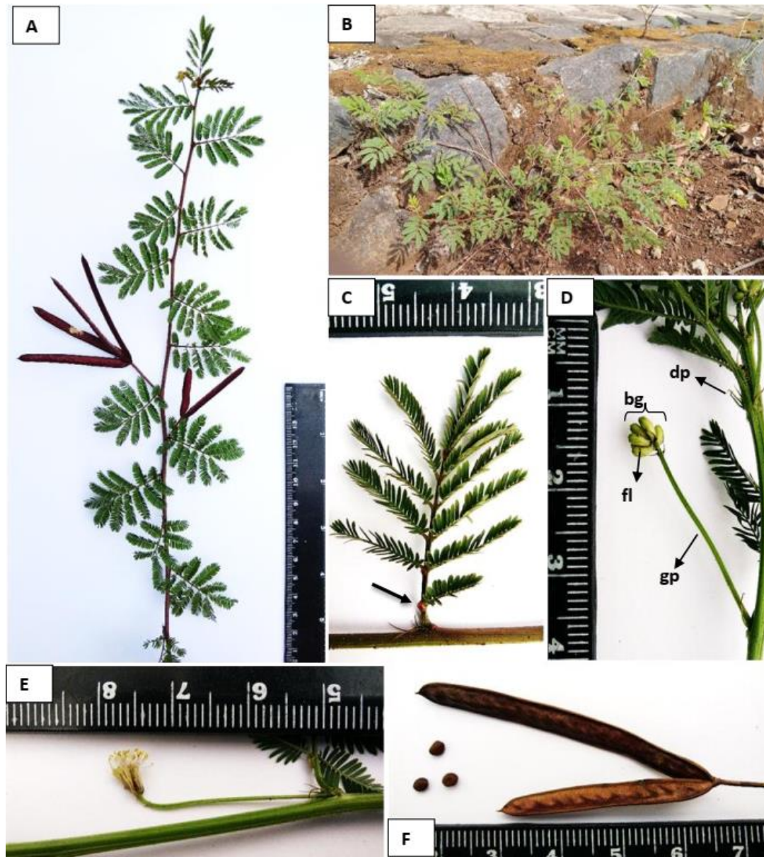
Gambar 1. Desmanthus virgatus (L.) Willd. (A) Ranting berbunga dan berbuah; (B) Perawakan; (C) Penampang satu helai daun majemuk menyirip ganda yang memperlihatkan kelenjar nektar ekstrafloral (panah); (D) Kuncup perbungaan (dp= daun penumpu, gp= gagang perbungaan, bg= satu perbungaan bonggol, fl= satu helai bunga); (E) Perbungaan mekar; (F) Buah dan biji

14 (FIPIA); Jogging track , Kampus ITB Jatinangor, Kecamatan Jatinangor, Kabupaten Sumedang, 27 September 2020, ASD Irsyam & A Mountara 15 (FIPIA). JAWA TENGAH. Desa Ujungnegoro, Kandeman, Batang, 3 September 2020, D Andari & Suroso s.n. (FIPIA).