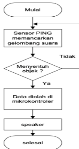
Gambar 4. Diagram alir penelitian

cm, papan yang berukuran 40 x 40 cm sebagai alas tiang atau tumpuan dan selanjutnya papan berukuran 20 x 10 cm sebagai tempat sensor.