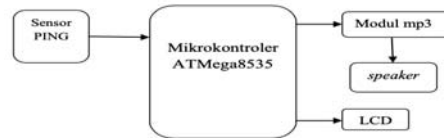
Gambar 2. Diagram Blok Sistem

BASCOS AVR untuk pembuatan program yang dijalankan di mikrokontroler. BASCOS AVR menyediakan pilihan yang dapat mensimulasikan