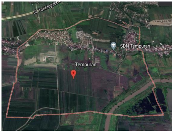
Gambar 2. Lokasi Penelitian