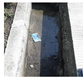
Gambar 6. Zona B