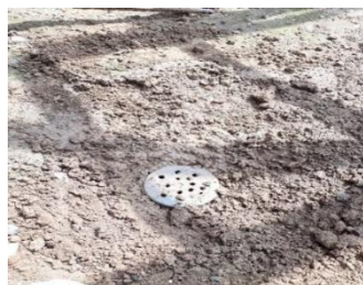
Gambar 11.LRB C

Hasil perhitungan nilai laju infiltrasi dapat dilihat pada Tabel 7