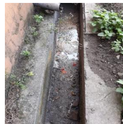
Gambar 5. Zona A

Zona A, B dan C yang dibahas pada studi ini dapat dilihat pada Gambar 5, 6 dan 7