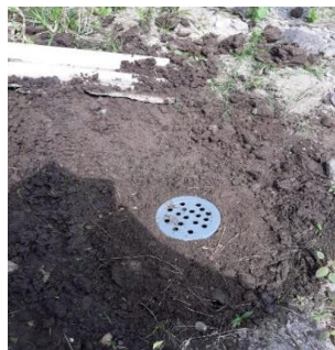
Gambar 9.LRB A