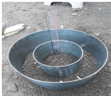
Gambar 8. Double Ring Infiltrrometer

Laju infiltrasi dapat dilakukan dengan menggunakan alat double ring infiltrometer (Gambar 8) yang bertujuan untuk mengetahui kapasitas infiltrasi yang kemudian dari nilai tersebut didapat parameter infiltrasi. Lubang resapan biopori A,B dan C dapat dilihat pada Gambar 9, 10 dan 11