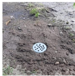
Gambar 10.LRB B