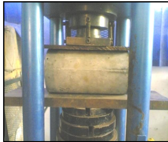
Gambar 3. Set up alat dan benda uji tarik belah

Pengujian kuat tarik belah beton dilakukan mengikuti SNI 03-2491-2002. Pengujian dilakukan dengan posisi benda uji silinder pada mesin seperti diperlihatkan Gambar 3. Benda uji ditekan dengan kecepatan 100 KN/menit hingga benda uji terbelah dari ujung ke ujung. Pengujian tarik belah ini menggunakan mesin uji Universal Compression Testing Machine kapasitas 150 ton.