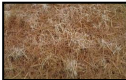
Gambar 2. Serat sabut kelapa

Tabel 1 di atas memperlihatkan nilai sifat fisis bahan pembentuk beton yang digunakan dalam penelitian ini. Material tersebut adalah split untuk agregat kasar, pasir untuk agregat halus dan semen tipe I. material dengan karakteristik tersebutlah yang telah dirancang proporsinya sebagai penyusun beton dengan fas 0,5 dan nilai slump 30-60 mm.