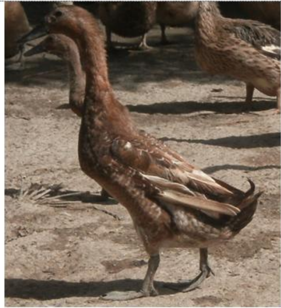
Gambar 1b. Itik Bayang Jantan

Selain marka morfologis, keragaman genetik dapat dipelajari dengan melihat variasi alel DNA berdasarkan penciri genetik molekuler. Keragaman genetik sangat diperlukan dalam upaya pemuliaan ternak, karena dengan diketahuinya keragaman genetik ternak dimungkinkan untuk membentuk bangsa ternak baru melalui seleksi dan sistem perkawinan. Marka molekuler dapat menyediakan kriteria kuantifikasi untuk mempelajari keragaman genetik, baik di dalam populasi, maupun antar populasi (Tixier-Boichard et.al. 2009).