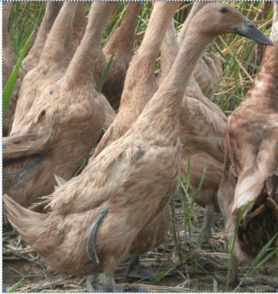
Gambar 1a. Itik Bayang Betina