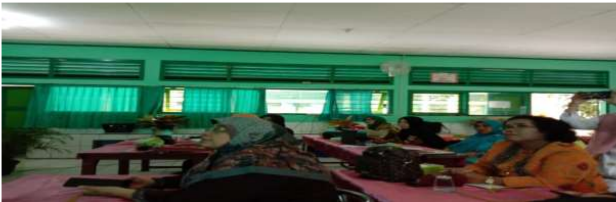
Gambar 3. Diskusi Judul Penelitian Tindakan kelas Guru-Guru Bahasa Inggris

Dalam diskusi ini mahasiswa yang terlibat juga membantu para peneliti (ketua dan anggota) oleh tiga mahasiswa Program prodi pendidikan bahasa Inggris. Disini mahasiswa-mahasiswa tersebut membantu para guru dalam mencari teori dan penelitian terdahulu di internet. Para mahasiswa ini mencari di Google dengan cara cepat dengan memakai aplikasi Open Knowledge Maps yang sudah dirancang oleh dosen yang mengadakan pengabdian ini.