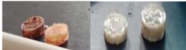
Gambar 1. Sampel komposit serat sabut kelapa dan ampas tebu

Sampel kemudian di uji dengan skema alat uji. Alat uji adalah berupa pipa PVC yang ditempatkan dalam ruang dandang yang terisolasi sehingga gangguan suara dari luar tidak mengganggu hasil penelitian. Intensitas bunyi sebelum melewati sampel dan intensitas bunyi setelah melewati sampel pada frekuensi 200 Hz, 400 Hz, 600 Hz, 800 Hz, 1000 Hz, sehingga dapat diketahui koefisien absorpsinya. Sampel komposit serat sabut kelapa dan ampas tebu serta proses pengambilan data dapat dilihat pada gambar 1 dan 2.