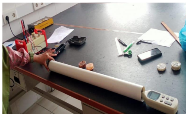
Gambar 2. Proses pengambilan data