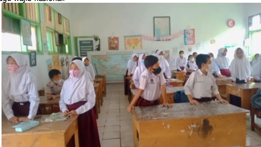
Gambar 3 Dokumentasi siswa ketika bernyanyi

Pada saat kegiatan menyanyikan lagu wajib nasional, beberapa siswa telah menyanyikan lagu wajib nasional dengan sikap tubuh yang baik yaitu berdiri tegak menghadap kedepan. Namun, beberapa siswa masih ada yang belum hafal, pandangan mata melihat kesana kemari, ada yang bernyanyi sambil merapikan pakaiannya, ada yang mengganggu teman sebangkunya dengan menyentuh kepalanya, ada siswa yang mengajak temannya berbicara ketika menyanyikan lagu wajib nasional dan ada siswa yang badannya setengah membungkuk sambil bermalas-malasan menyanyikan lagu wajib nasional.