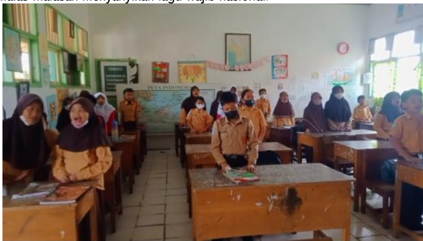
Gambar 1 Observasi Penerapan menyanyikan lagu wajib nasional

Dari hasil observasi penelitian dapat dilihat bahwa ketika bernyanyi masih banyak siswa yang belum mengetahui pentingnya menyanyikan lagu wajib nasional dan apa makna syair lagu wajib nasional dan hal tersebut berpengaruh pada sikap siswa ketika bernyanyi yaitu siswa tidak fokus, posisi badan yang tidak siap, ada yang merapikan pakaian dan badan setengah membungkuk sambil bermalas-malasan menyanyikan lagu wajib nasional.