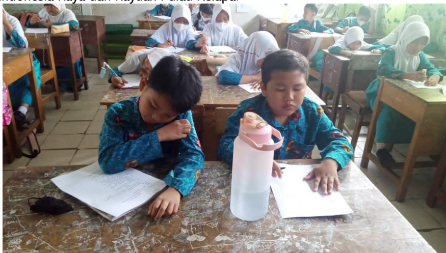
Gambar 2 Dokumentasi pengisian angket oleh siswa

Secara keseluruhan hasil angket tentang Implementasi pesan pada lagu Bagimu Negeri dan Satu Nusa Satu Bangsa memiliki skor tertinggi yaitu 14 siswa dapat menjawab dengan benar, sedangkan tidak ada satupun siswa yang dapat menjawab dengan benar implementasi pesan dari syair lagu Indonesia Raya dan Rayuan Pulau Kelapa.